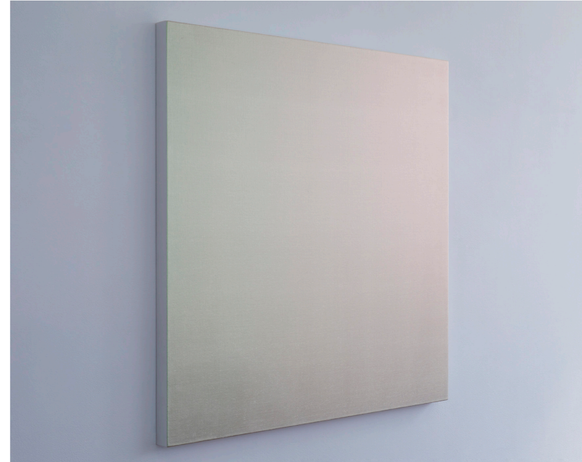
"Vendarta 91- KUGINPYTG", 2017, Acrylic on canvas, 91×91×4 cm